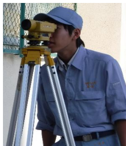
レベルで高低差を測っています。