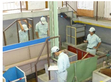
量水ますを使って水が満杯になるまでの時間を計っています。