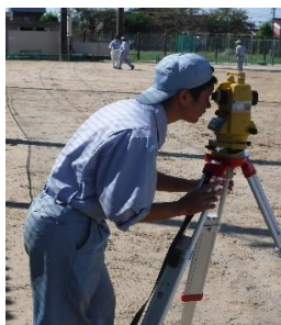
セオドライトで角度を測っています。