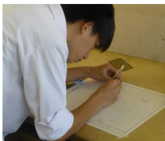
トレース紙にコンパスを使って円を描いているところです。