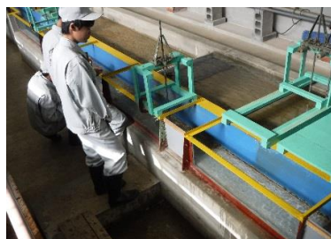
ポイントゲージで水の高低差を測っています。