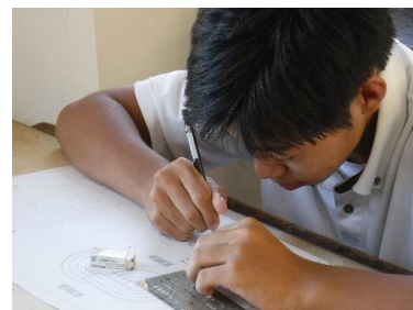
ケント紙に数字のテンプレートを使って寸法を入れています。